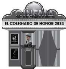
Imagen 2. Fachada de CINEMA AÑOS 50.

Esta misma zona funcionará como el área de Photobooth, en la cual se debe incluir el servicio de luces a los lados de colores, luces de un solo color en el suelo y parlante para poner música de ambiente Disco.