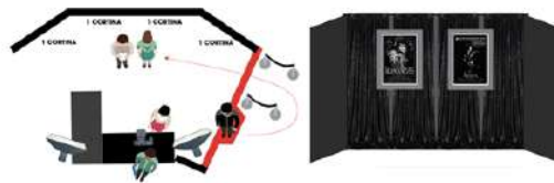
Imagen 1. Fondo decorativo.